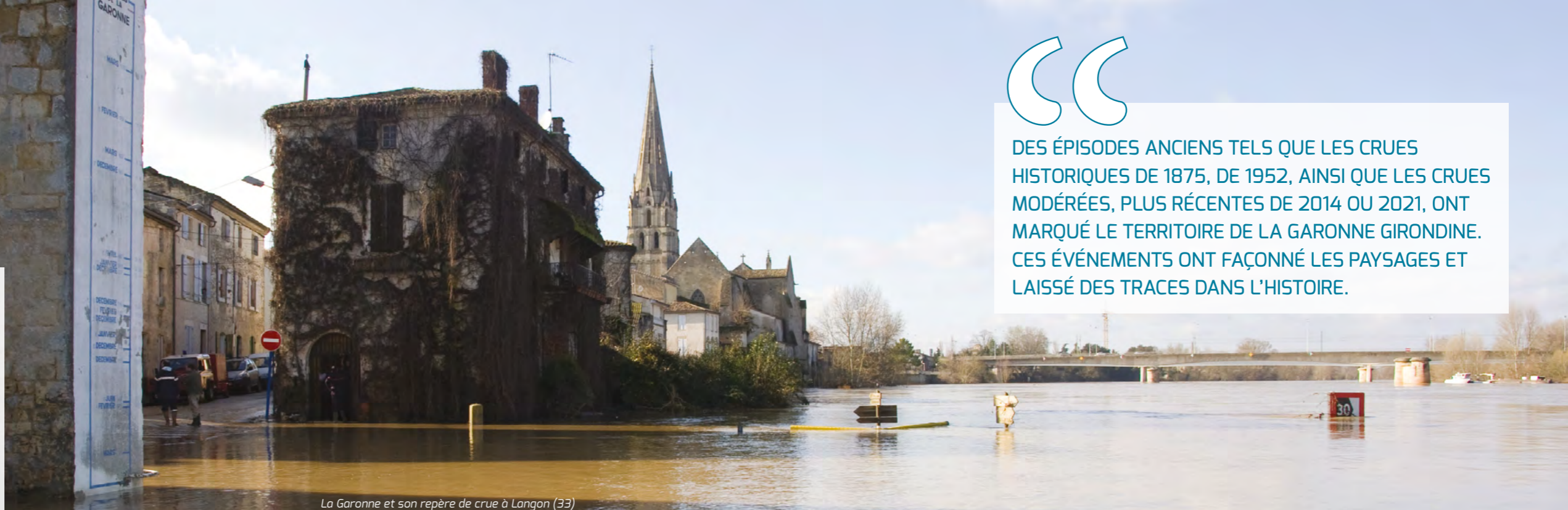
La Garonne et son repère de crue à Langon (33)