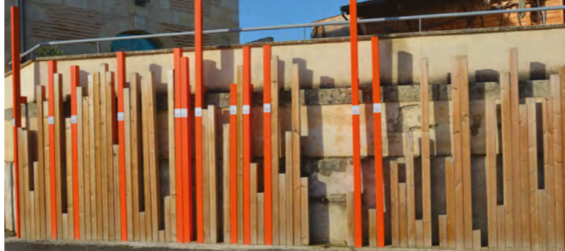
Repère de crue - Couthures-sur-Garonne (47)

En rendant visible les hauteurs d'eaux atteintes lors d'événements passés, les repères permettent de marquer la fréquence des débordements des fleuves et cours d'eau et rappellent aux populations quels sont les niveaux de risques encourus.