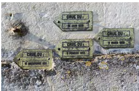
Repères de crues historiques

En maillant le territoire, ils favorisent la re-contextualisation des événements et facilitent la collecte d'informations post-inondation.