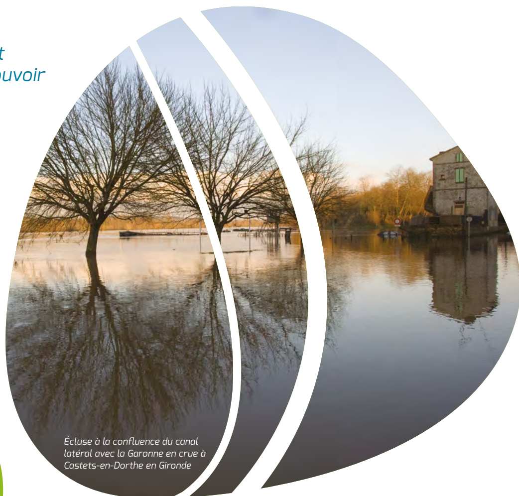
Écluse à la confluence du canal latéral avec la Garonne en crue à Castets-en-Dorthe en Gironde

Maître de conférences sur les vulnérabilités et risques majeurs