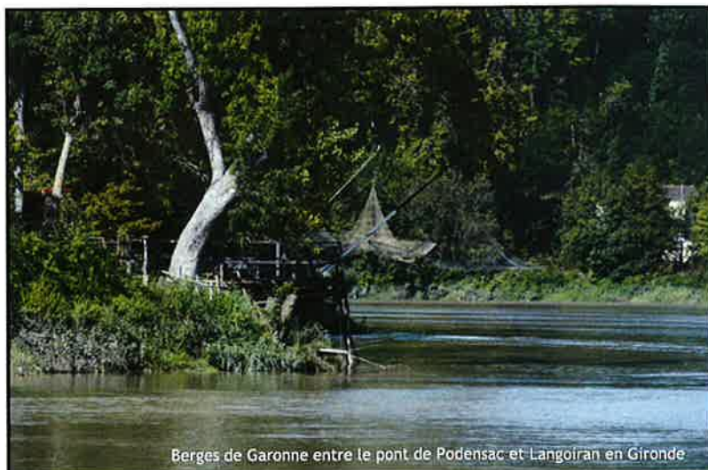
Berges de Garonne entre le pont de Podensac et Langoiran en Gironde

L'ensemble de la Garonne est inscrit au réseau Natura 2000 (directive Habitats), de ses sources espagnoles jusqu'à l'estuaire de la Gironde : Riu Garona (ES5130034), la Garonne en Midi-Pyrénées (FR7301822), la Garonne en Aquitaine (FR7200700) et l'Estuaire de la Gironde (FR7200677).