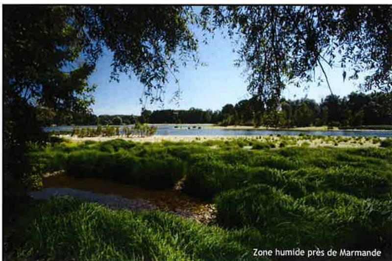
Zone humide près de Marmande

En se replaçant dans une logique de bassin versant, le site est essentiel dans la distribution de nombreuses espèces sur l'ensemble des sous-bassins versants du réseau hydrographique. La préservation de la biodiversité sur la Garonne en Aquitaine ne peut être dissociée des actions menées sur les sites adjacents : la Garonne et ses affluents en Midi-Pyrénées abritent les zones de reproduction et de croissance de plusieurs espèces de poissons, notamment le Saumon. Le Ciron, le Dropt, l'Ourbise ou encore le Gât Mort et le Saucats sont des affluents où les habitats favorables au Vison d'Europe sont présents.