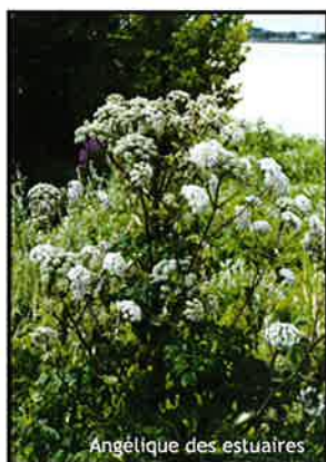
Angélique des estuaires

lesquelles, les pollutions diverses d'origine agricole, domestique ou industrielle, la présence et l'expansion de plantes exotiques et invasives, les prélèvements en eaux, l'urbanisation etc. Ces menaces induisent, aussi bien pour les habitats que pour les espèces, des états de conservation variables avec une dominance plutôt mauvaise. Par ailleurs, une majorité des habitats et des espèces voient leur état de conservation se dégrader.