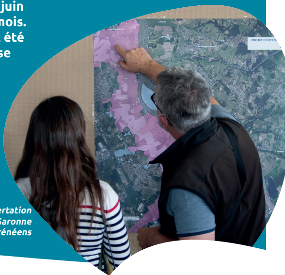
Atelier de concertation à Villenave-d'Ornon - EP Garonne Gascogne et affluents pyrénéens

La procédure officielle auprès des services de l'État a débuté en juin et juillet 2024 et la consultation des collectivités a duré quatre mois. À l'issue de cette phase, 12 avis favorables et 2 défavorables ont été reçus par les services de l'État. Suite à la validation de la synthèse de cette consultation par le préfet coordinateur de Lot-et-Garonne, la prochaine étape est la sollicitation du Ministère de la Transition Écologique et du Développement Durable ainsi que la Commission Européenne, prévue en 2026. Le Muséum National d'Histoires Naturelles sera également mobilisé pour un avis consultatif sur l'aspect technique de la proposition d'extension du site.