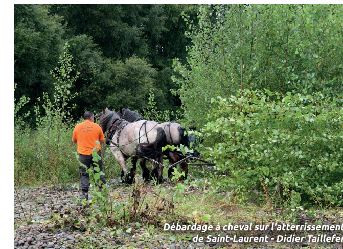
Débardage à cheval sur l'atterrissement de Saint-Laurent - Didier Taillefer

À Saint-Laurent, de précédentes actions ont été menées en 2017 comme la densification de la ripisylve par la mise en place de végétaux adaptés aux berges de Garonne ou encore la remobilisation sédimentaire par l'arrachage de la végétation sur un atterrissement, en lit mineur de Garonne. Aujourd'hui, malgré la dynamique de fermeture du milieu, l'objectif est de préserver des secteurs à enjeux sur l'atterrissement comme une roselière qui s'est étendue à la suite de travaux de dévégétalisation. Des actions d'arrachage de ligneux par débardage à cheval sont prévus comme cela a été fait en 2021 sur des secteurs précis. L'implication des locaux est également indispensable pour la réussite de tels projets. Ils seront mobilisés pour l'entretien futur de cet espace. De plus, quelques végétaux seront également replantés en berge de Garonne afin de densifier davantage la ripisylve notamment en pied de berge.