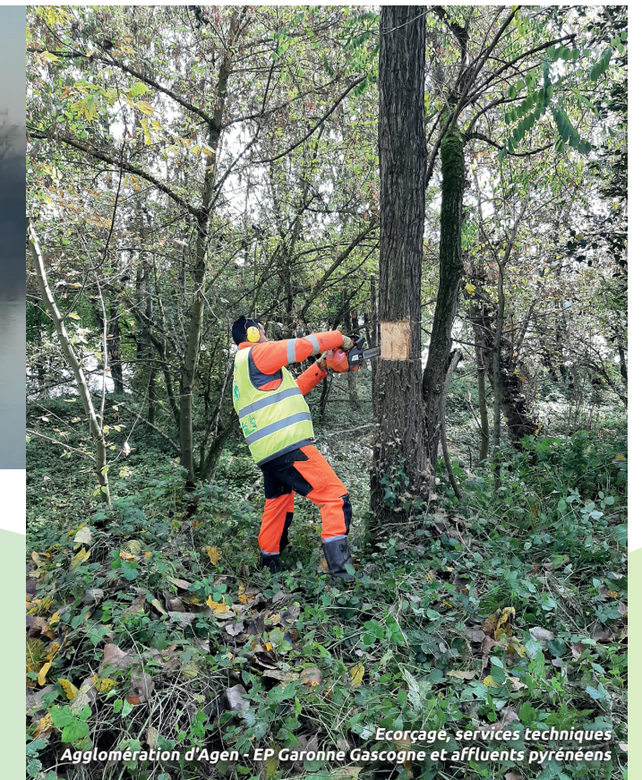
Ecorçage, services techniques Agglomération d'Agen - EP Garonne Gascogne et affluents pyrénéens

L'agglomération d'Agen a également mené de précédentes actions sur les berges sur la commune du Passage d'Agen. Parmi elles, le retrait raisonné d'embâcles gênants ainsi que le cerclage et écorçage de ligneux invasifs (principalement des érables negundo et robiniers faux-acacia). Cette méthode d'épuisement progressif de l'arbre sur son pied, est efficace sur ces espèces mais doit être renouvelée sur plusieurs années. C'est pourquoi, l'agglomération d'Agen souhaite effectuer ce cerclage sur certains sujets sur des secteurs précis. Ce second contrat permettra également de réaliser des panneaux pédagogiques permettant d'informer la population des actions menées sur ce site.