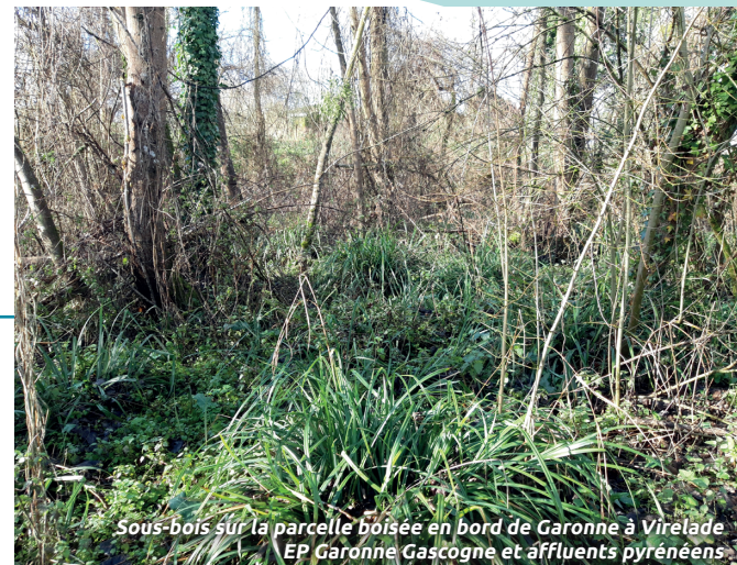
Sous-bois sur la parcelle boisée en bord de Garonne à Virelade - EP Garonne Gascogne et affluents pyrénéens